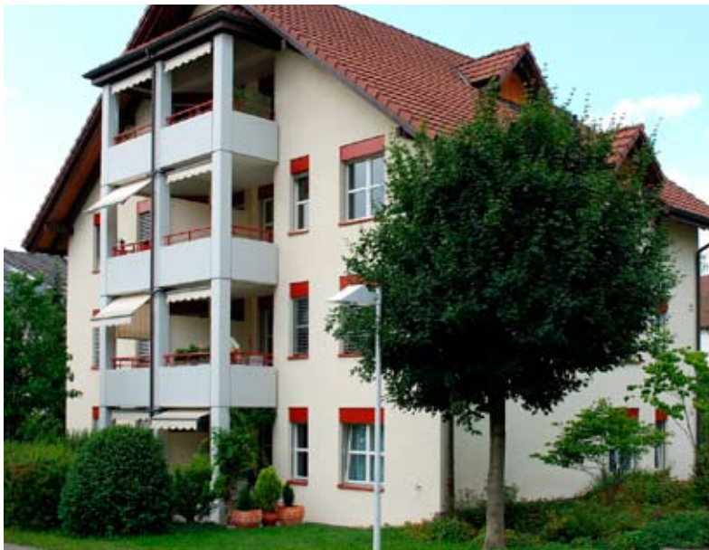
Alterwohnungen Neuhushof 5

(*1961) wurden alle an der Luzernerstrasse 146 geboren, Urs (*1966) kam einige Jahre später zur Welt, als wir schon an der Grubenstrasse 11 wohnten. Schon damals hatte mein Mann ein Büro in der Wohnung, der Platz war mit sieben Familienmitgliedern in einer 4 Zimmerwohnung (75 m 2 ) also sehr begrenzt!