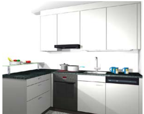
Küche nach dem Umbau

Andere Liegenschaftsverwaltungen wollen den Mietern diese