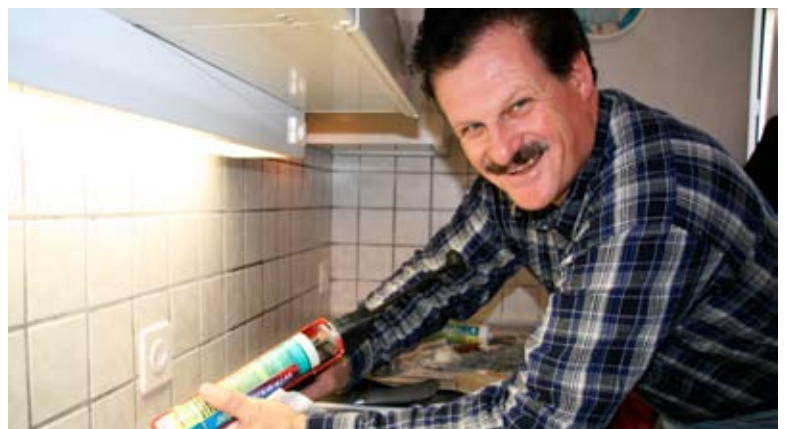
Kittfugen erneuern im Neuhushof 5

Der Nachmittag beginnt mit dem Ersatz einer defekten Silikonfuge