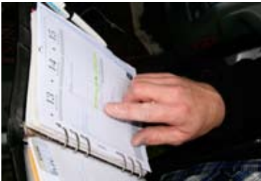
Blick in die Agenda

Stolz weist er später beim Verlassen des Gebäudes auf die neue Gestaltung der Umgebung hin. Auch freut er sich sehr darüber, dass die Bäume endlich kein Laub mehr tragen: „Das gibt immer eine Riesensauerei um die Häuser!“